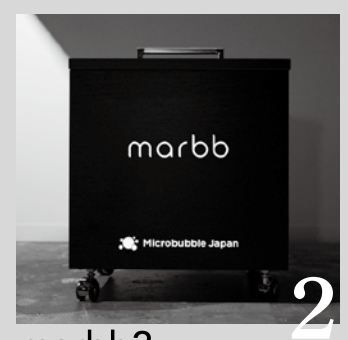
marbb2 寸法: H510mm×W420mm×D420mm 重量: 約23kg 1台で2台のシャンプー台に対応

従来のリニューアルの他、本体のサイズも小型化し1台でシャンプー台2~3台まで接続可能に。仕上がりのクオリティアップ→客単価アップに最大限に活用できます!