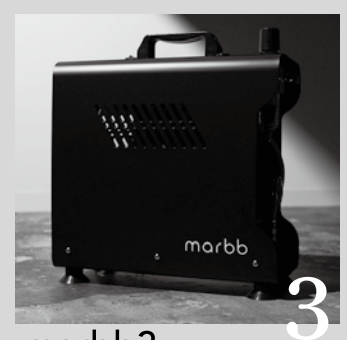
marbb3 寸法: H350mm×W165mm×D350mm 重量: 約12.5kg 1台で最大3台のシャンプー台に対応